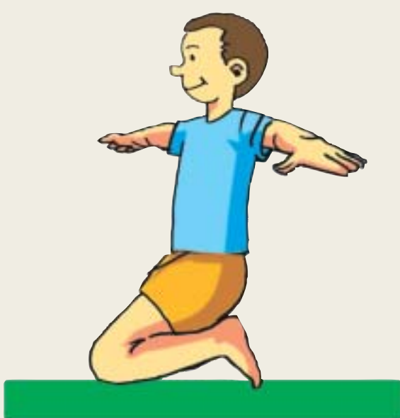
a. Sentarse sobre los talones manteniendo los brazos en cruz.

2) Arrodillado sobre una colchoneta apoyando la punta de los dedos de los pies: