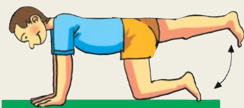
c. Estirar una pierna hacia atrás, bajar y estirar la otra.