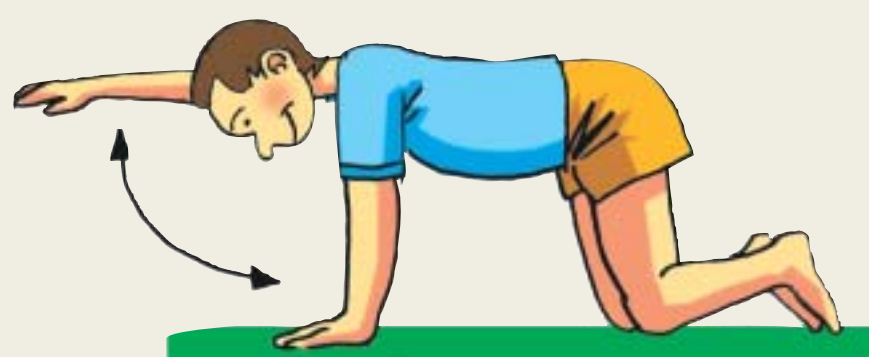
a. Estirar un brazo hacia delante y bajar.