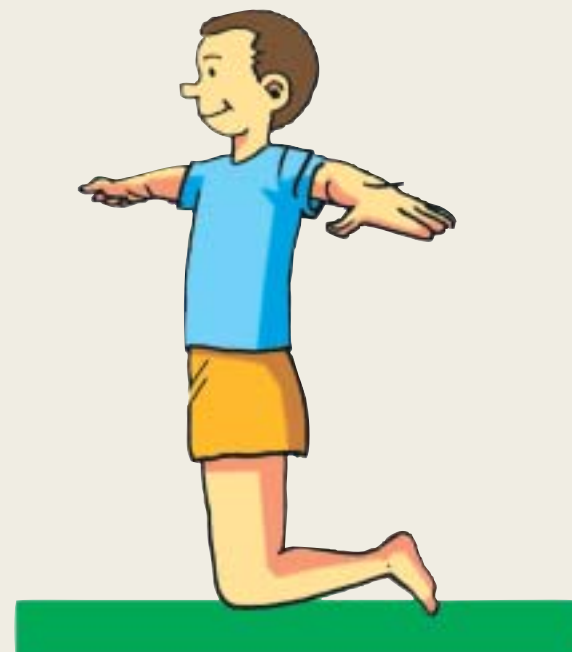
b. Levantar la pelvis hasta quedar en la postura inicial.

2) De pie teniendo cerca una superficie estable para cogerse en caso de desequilibrio.