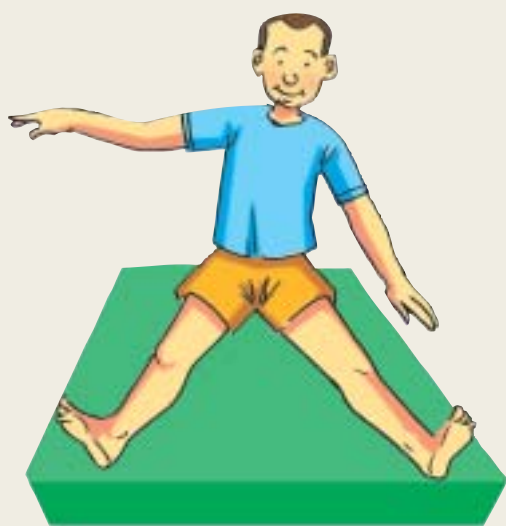
b. Cambiar trasladando el peso hacia el lado izquierdo.

1) Intentar mantener el equilibrio arrodillado sobre una pierna y con la otra doblada con el pie plano hacia el suelo.