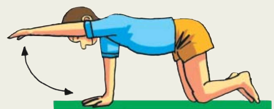
b. Estirar el otro brazo y bajar seguidamente.