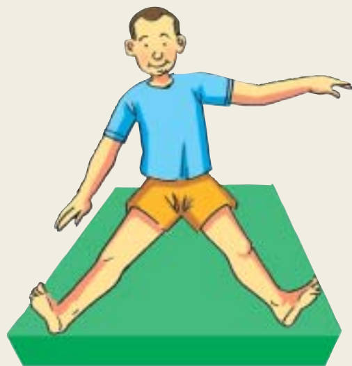
a. Trasladar el peso del cuerpo hacia el lado derecho.

1) Sentado sobre una colchoneta con las piernas estiradas y las manos apoyadas en el suelo: