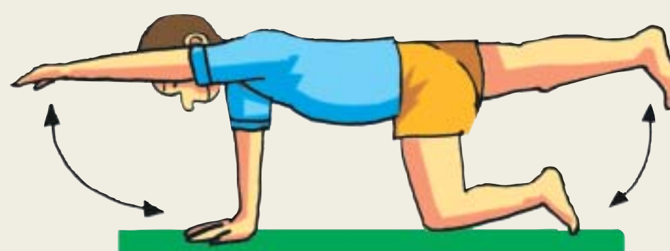
d. Una variación más complicada consistiría en levantar una pierna a la vez que se levanta el brazo contrario.

Las sesiones no pueden exceder los 30 minutos y se realizarán una o dos veces al día (preferentemente a la misma hora para que se convierta en una rutina) y siempre en lugar fresco.